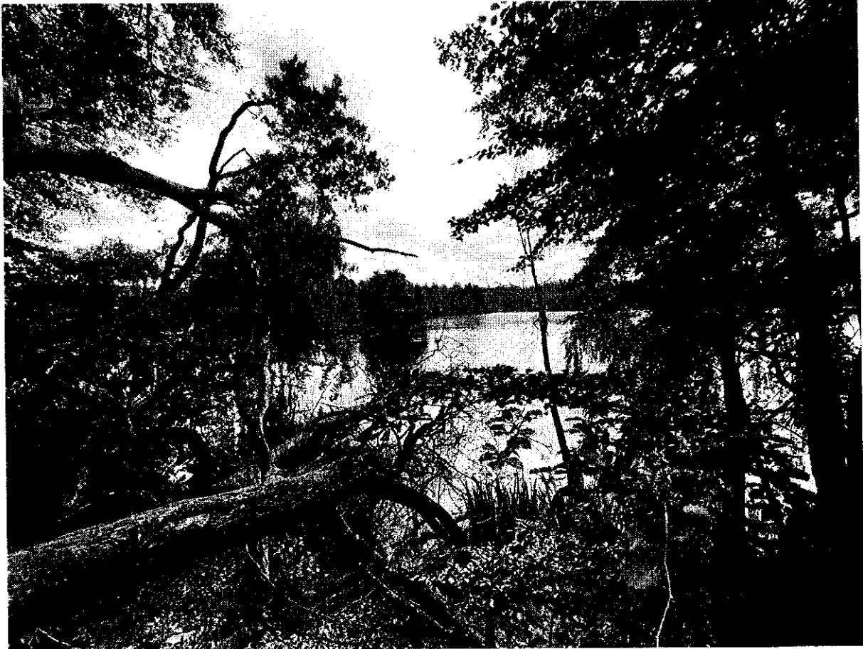
Fot. 2. Widok z brzegu jez. Pyszne na tafłę jeziora