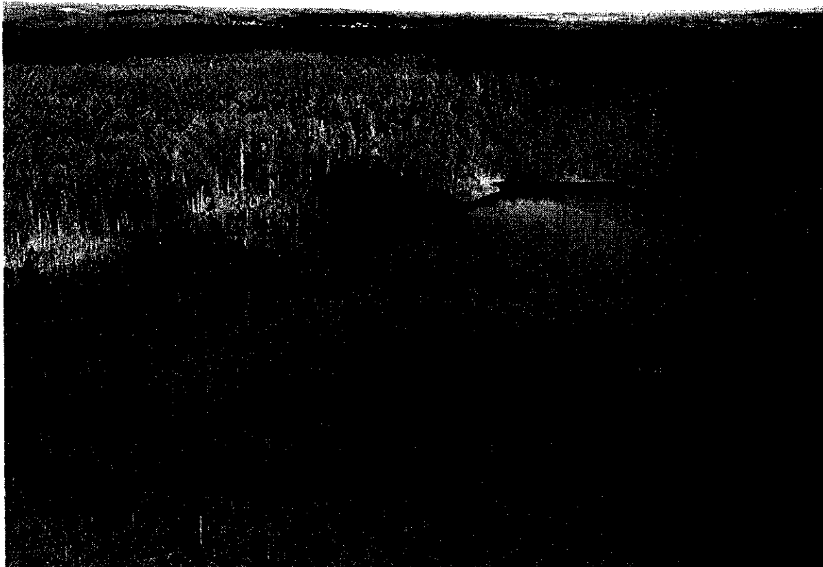
Fot. 1. Widok lotniczy na torfowiska rezerwatu Lisia Kępa