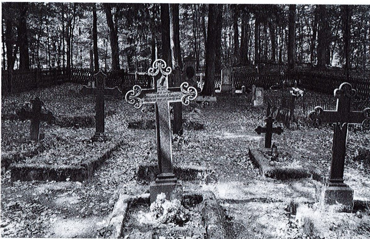
Fot. 3. Cmentarz leśników na Bukowej Górze